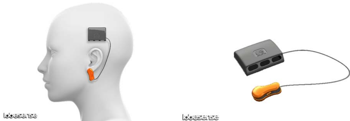
【図 1】「暑熱ストレス計測システム」概要