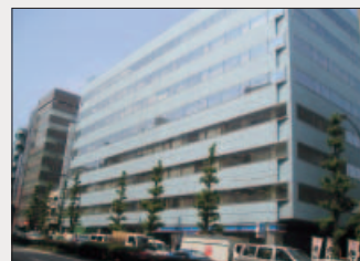
本社ビル 東京都品川区

当社グループは、事業拠点の集中により業務効率の向上を図るため、2004年1月18日に本社移転をいたしました。また、地域の医療機関との連携を深めるため、2004年4月広島県広島市に中国支社を、石川県金沢市に北陸支社を開設いたしました。